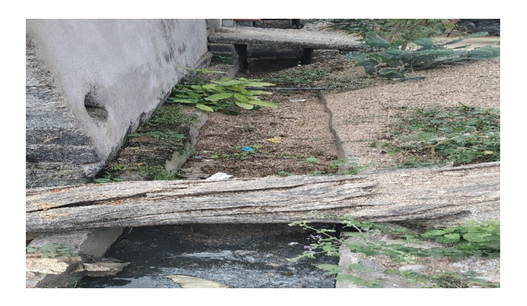
Picture 4- Blocakage of drain due to accumulation of silt and poor gradient design